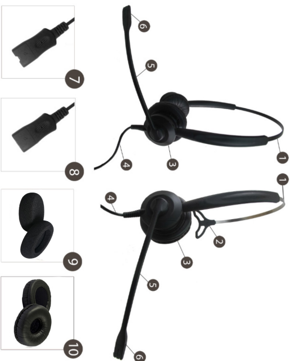
ชุดหูฟัง Xenexx ของท่านประกอบด้วย

ขอบคุณท่านที่อุทิศทุนสนับสนุนด้านอุปกรณ์หูฟังของ Xenexx ทางบริษัทฯ มั่นใจว่าท่านจะผลิตประสิทธิภาพที่ดีขึ้นแก่ของเรา คู่มือการใช้งานฉบับนี้ประกอบด้วยคำแนะนำในการติดตั้ง และการใช้หูฟังชุดใหม่ของท่าน